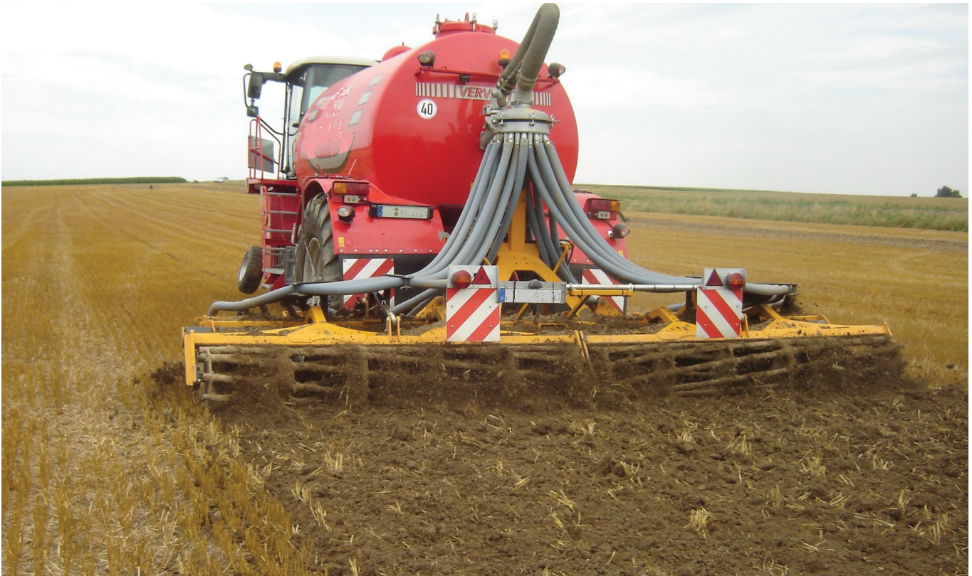
Verlustarme Gülleaufbringung durch direkte Einarbeitung