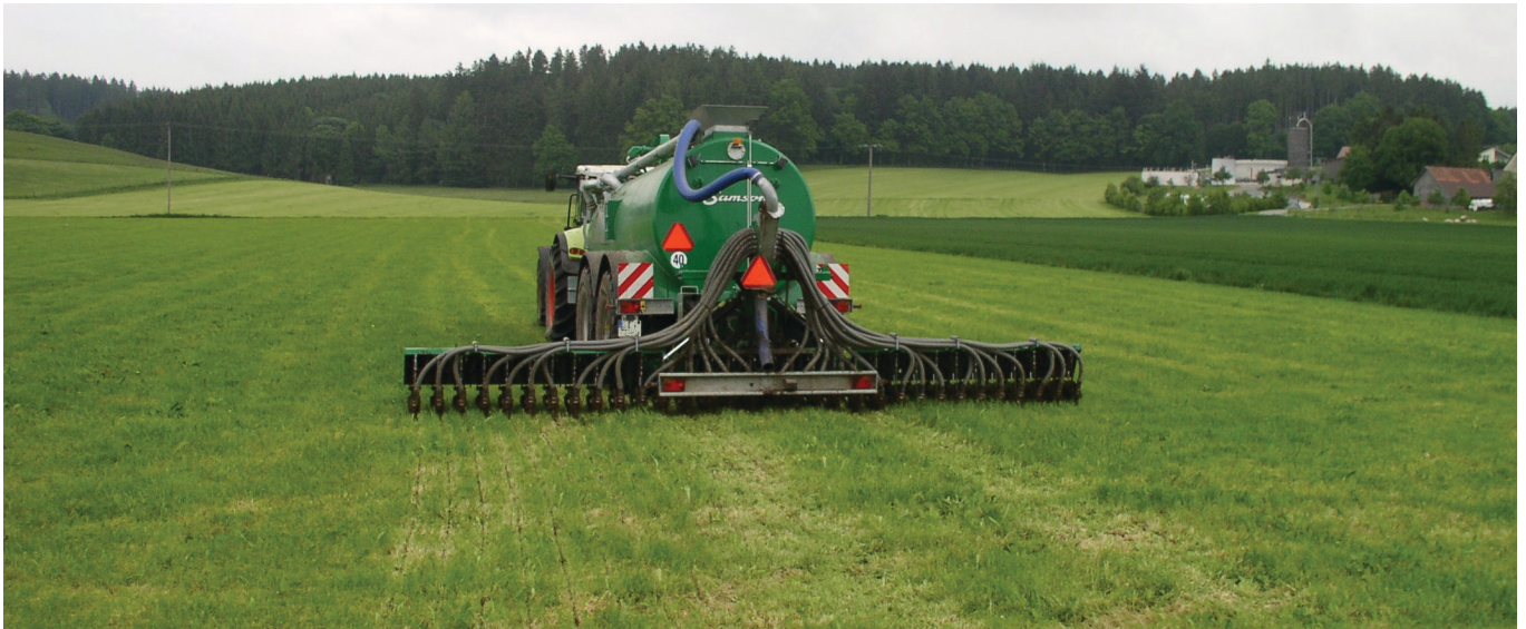
Verlustarme Gülleaufbringung mit einem Injektionsverfahren

Verordnung über die Anwendung von Düngemitteln, Bodenhilfsstoffen, Kultursubstraten und Pflanzenhilfsmitteln nach den Grundsätzen der guten fachlichen Praxis beim Düngen (Düngeverordnung–DüV) vom 26. Mai 2017, BGBl. I 2017, Nr. 32, S. 1305–1348